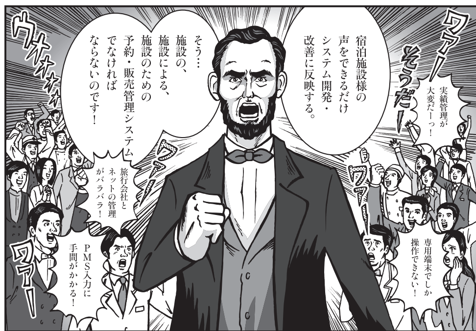
TL-リンカーン導入後のお客様の「声」を大切にします。ここ1年間の実績では、お客様からいただいた「声」をもとに300件以上のシステム改善を実施。次期システムの開発もお客様の「声」をもとに行なっています。