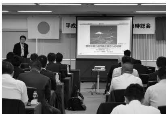
JNTOの担当者から日本のインバウンド政策を聞いた今年9月の「県部長サミット」