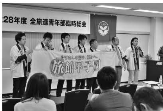
「旅館甲子園」の担当者も事業をアピール。本番は来年2月22日