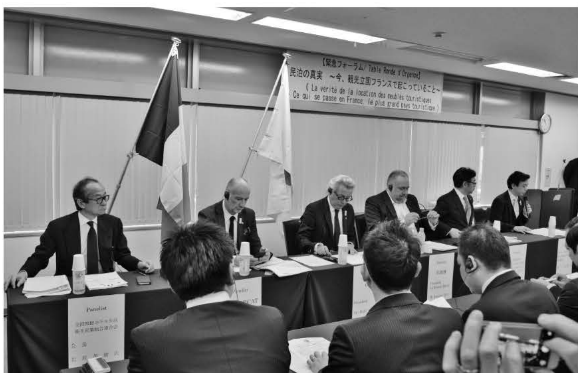
今年3月、青年部主導で行われた民泊問題に関する「緊急フォーラム」。フランスのホテル業界のトップを招き、同国の民泊の現状を話してもらった