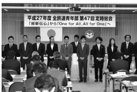
「桑田体制」始動の27年度定時総会で各委員会がメンバーと活動方針を紹介