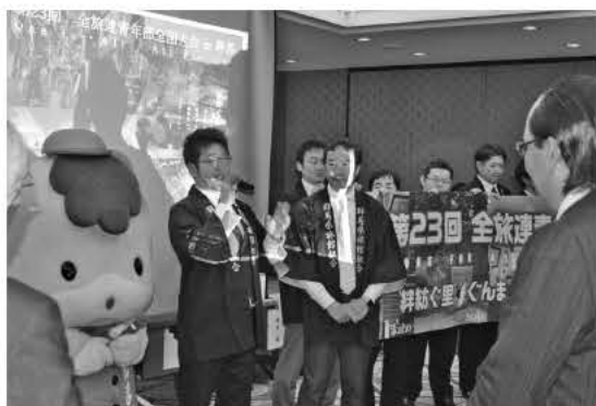
全国大会への参加を「ぐんまちゃん」とともに呼び掛ける群馬県青年部のメンバー