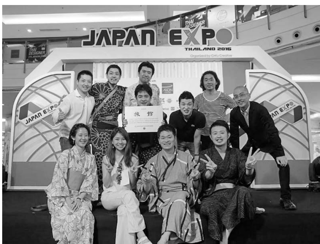
今年開かれたタイ・バンコクの「ジャパンエキスポ・タイランド2016」でも旅館をPR。来場者に浴衣の試着や日本酒の試飲を楽しませた