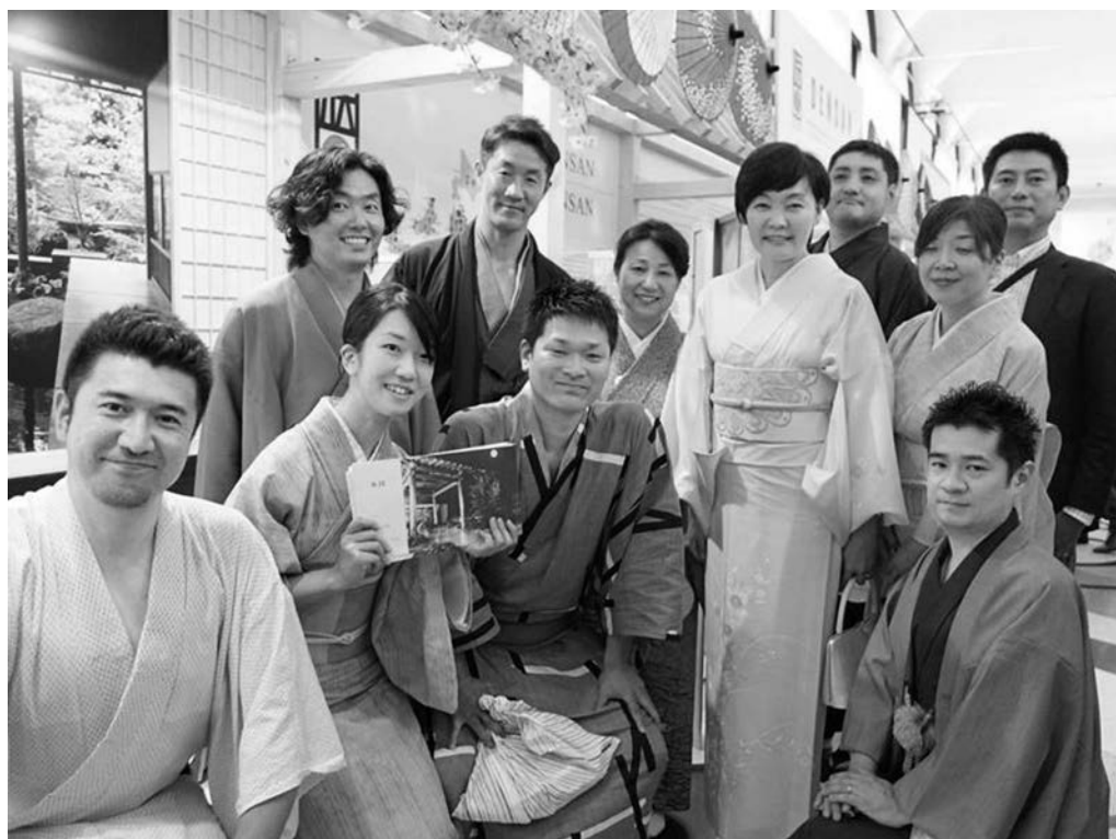
27年のイタリア・ミラノ万博で旅館と日本文化をPR。ブースには安倍晋三首相夫人の昭恵さんも訪れた