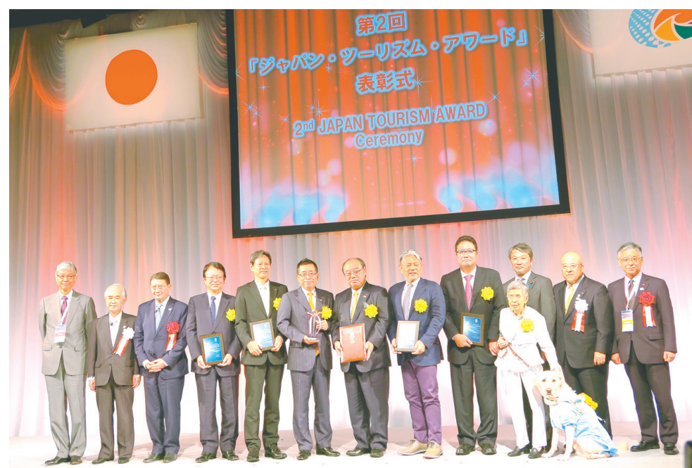
開会式に続いて行われたジャパン・ツーリズム・アワード表彰式で登壇した受賞者たち（9月22日）