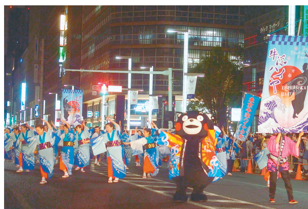
JAPAN"Smile"Bridgeでの熊本「牛深ハイヤ踊り」（9月22日）