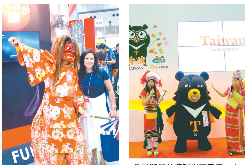
福岡市ブースで記念撮影する外国人来場者（9月25日）