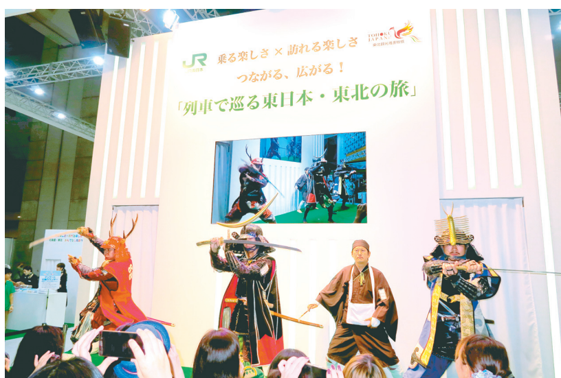
JR東日本・東北観光推進機構ブースでの戦国武将アトラクション（9月25日）