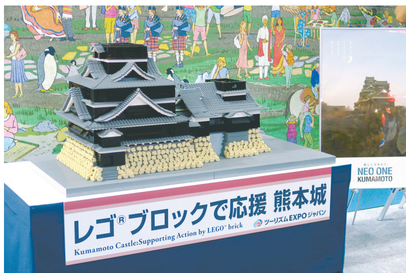
来場者が寄付の形で購入したLEGOブロックで熊本城を作り、熊本観光を応援