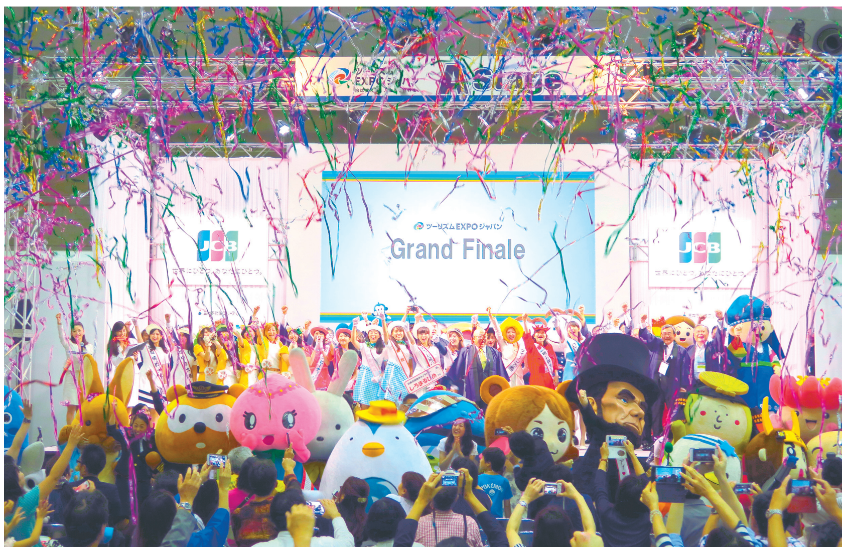
閉会式後に行われたグランドフィナーレ（9月25日）

過去最高となる18万5800人の来場があった「ツーリズムEXPOジャパン2016」。ここでは会期4日間の模様を写真で紹介する。