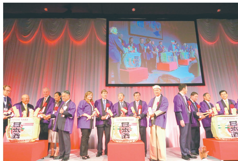
JAPAN NIGHT招待者レセプション（国際交流の夕べ）の鏡開き（9月22日）