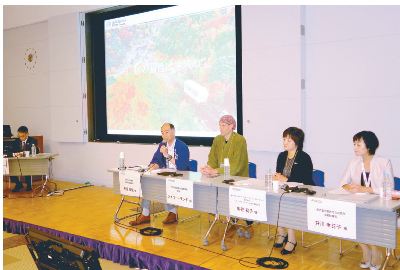
訪日旅行シンポジウム「持続可能な地方誘客～日本旅館と地域のコラボレーション」（9月23日）