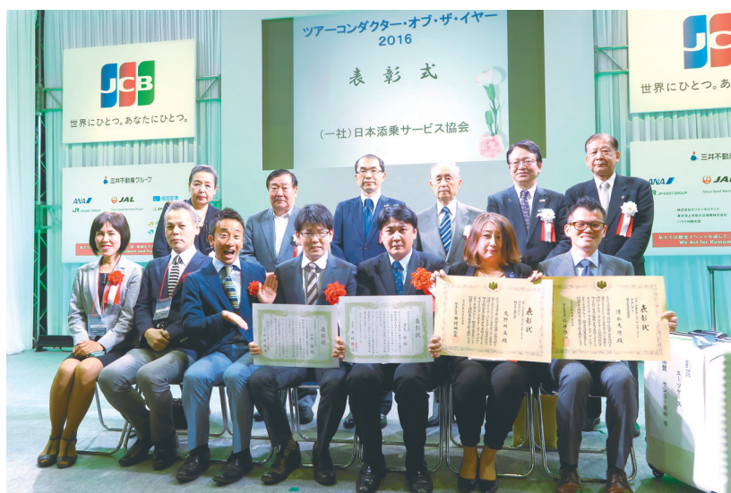
ツアーコンダクター・オブ・ザ・イヤー2016表彰式（9月23日）