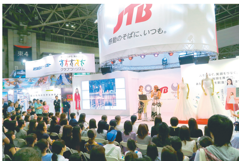
芸能人トークイベントで満席のJTBブース（9月25日）