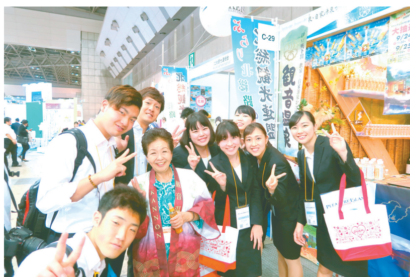
9月23日の業界日には大学、専門学校で観光を学ぶ学生が数多く来場した