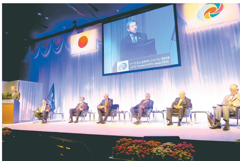
グローバル観光フォーラム基調シンポジウムで冒頭あいさつする田村明比古観光庁長官（9月22日）