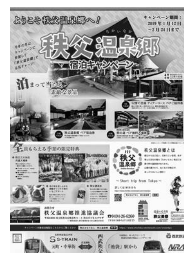
秩父温泉郷キャンペーンのポスター

埼玉県秩父市、小栗野町、湯田中温泉郷では、温泉郷の魅力を伝えるためのパンフレットを作成し、観光客に配布した。また、温泉郷の魅力を伝えるためのパンフレットを作成し、観光客に配布した。 「温泉郷」は、温泉郷の魅力を伝えるためのパンフレットを作成し、観光客に配布した。また、温泉郷の魅力を伝えるためのパンフレットを作成し、観光客に配布した。 「温泉郷」は、温泉郷の魅力を伝えるためのパンフレットを作成し、観光客に配布した。また、温泉郷の魅力を伝えるためのパンフレットを作成し、観光客に配布した。 「温泉郷」は、温泉郷の魅力を伝えるためのパンフレットを作成し、観光客に配布した。また、温泉郷の魅力を伝えるためのパンフレットを作成し、観光客に配布した。 「温泉郷」は、温泉郷の魅力を伝えるためのパンフレットを作成し、観光客に配布した。また、温泉郷の魅力を伝えるためのパンフレットを作成し、観光客に配布した。