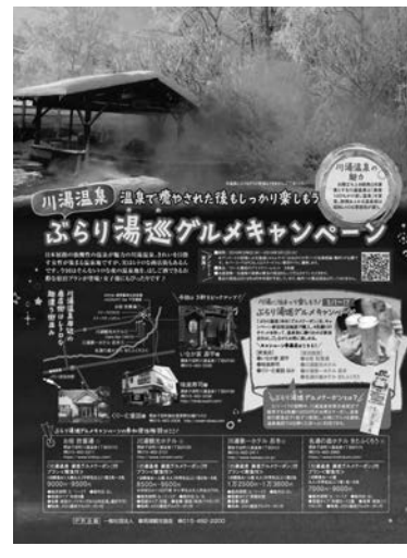
「湯巡り」キャンペーンのポスター

北海道摩周湖観光協会は、湯巡りの魅力を伝えるためのパンフレットを作成し、観光客に配布した。また、湯巡りの魅力を伝えるためのパンフレットを作成し、観光客に配布した。 「湯巡り」は、湯巡りの魅力を伝えるためのパンフレットを作成し、観光客に配布した。また、湯巡りの魅力を伝えるためのパンフレットを作成し、観光客に配布した。 「湯巡り」は、湯巡りの魅力を伝えるためのパンフレットを作成し、観光客に配布した。また、湯巡りの魅力を伝えるためのパンフレットを作成し、観光客に配布した。 「湯巡り」は、湯巡りの魅力を伝えるためのパンフレットを作成し、観光客に配布した。また、湯巡りの魅力を伝えるためのパンフレットを作成し、観光客に配布した。 「湯巡り」は、湯巡りの魅力を伝えるためのパンフレットを作成し、観光客に配布した。また、湯巡りの魅力を伝えるためのパンフレットを作成し、観光客に配布した。