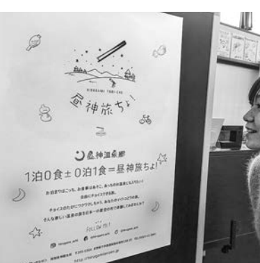
昼神温泉宿泊施設連携推進協議会の様子

長野県阿智村では、昼神温泉宿泊施設連携推進協議会を組織し、夕食の選択肢を広げるための予約システムを開発している。また、夕食の選択肢を広げるための予約システムを開発している。 「予約システム」は、予約システムを開発している。また、予約システムを開発している。 「予約システム」は、予約システムを開発している。また、予約システムを開発している。 「予約システム」は、予約システムを開発している。また、予約システムを開発している。 「予約システム」は、予約システムを開発している。また、予約システムを開発している。