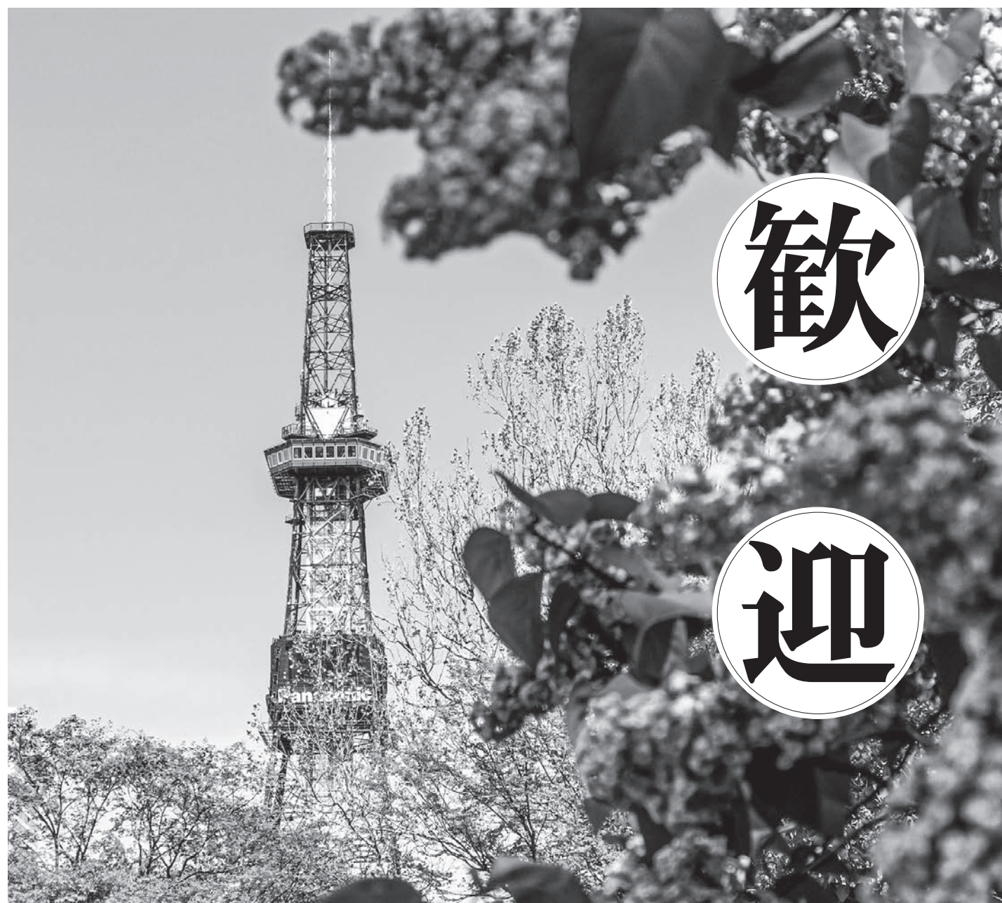
全国大会が開かれる札幌市のシンボル「さっぽろテレビ塔」