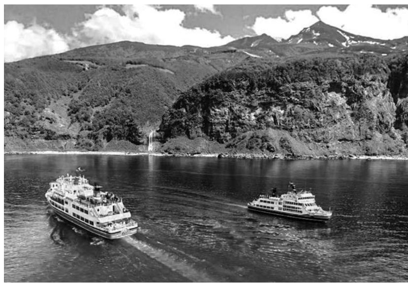
知床観光船(斜里町)