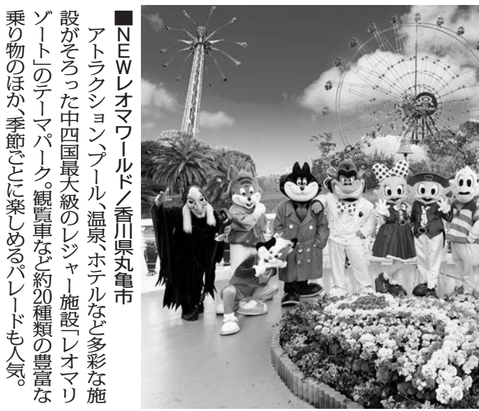
■NEWレオマワールド/香川県丸亀市 アトラクション「ブルー温泉」ホテルなど多彩な施設をそろえた中四国最大級のレジャー施設「レオマリゾート」のテーマパーク。観覧車を約20種類の豊富な乗り物のほか、季節ごとに楽しめるパレードも人気。 ■文化の森総合公園/徳島市 園内を流れる緑豊かな丘陵地に位置する文化施設と自然が融合した文化公園。博物館や近代美術館、21世紀館等の県立施設が集まり、周りには施設と関連したテーマを持つ公園や森林が広がっている。