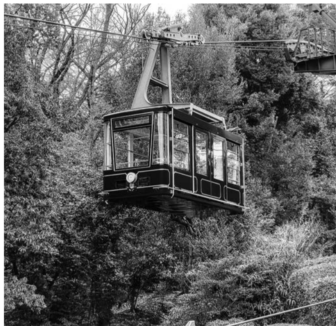
■松山城ロープウェイ・リフト/松山市 松山城の山麓駅「東雲口」から8合目付近の山頂駅「長者ヶ平」を結ぶ。2月にロープウェイの Gondola がリニューアルし、青色のロイヤルブルーを基調としたデザインに。城山上で発生した土石流により営業休止していたが、7月31日に危険箇所を除き全面営業再開した。

※①「大観覧車くるりん」のピーク時入り込み客数は、入館を把握できている2015年度以降のピーク値。(実際のピーク時の数値とは異なる) ※②「しまなみ海道レンタサイクル」は、2022年4月から4CS(サイクルステーション)が2CSに減少した。2019年度まで通って2CSのデータに修正を行った。 ※③2020年4月1日から現在の館名に変更。(旧: 村上水軍博物館) ※④「マイントピア別子」は2021年度から集計方法を変更。