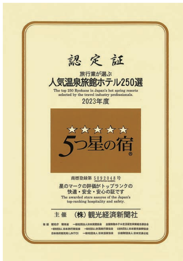
本社主催「人気温泉旅館ホテル250選」に入選以上入選した宿に贈られる「5つ星」の認定証

ドッグランなど客室設備充実 湯元こんぴら温泉華の湯紅梅亭(犬と泊まる)は今年6月、愛犬と泊まれる宿「紅梅亭別邸 犬のみ」まで宿泊可能で、全てを犬と泊まれる宿としてオープンした。この客室は愛犬と一緒に楽しめるように、犬のしつけや、犬の健康に配慮した設備が揃っているほか、テラス併設のドッグランを用意し、共有スペースにもドッグランを設けており、他の宿泊客との交流が楽しめる。食事は部屋食で、犬用メニューも提供(別途有料)している。 そのほか、ゲージやトイレ、フードボウル、粘着ローションなど犬用アメニティも豊富で、細やかな気遣いも忘れられない。 ▼湯元こんぴら温泉華の湯紅梅亭は香川県仲多度郡平野町556の1。☎0877(7)1111。https://www.koubatei.jp/