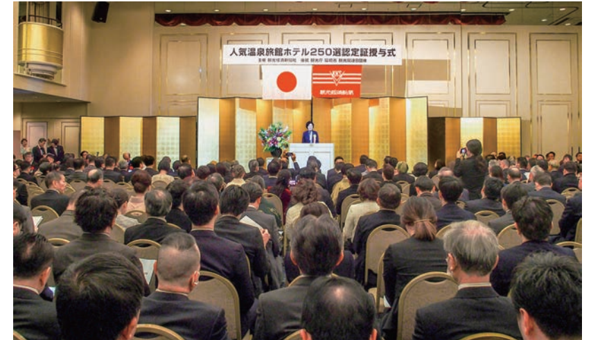
「2023年度人気温泉旅館ホテル250選」の認定証授与式 (2024年1月19日、東京都内)

この特集は「観光経済ドットコム」でもご覧いただけます https://www.kankokeizai.com/