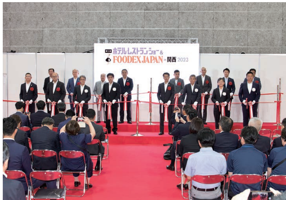
昨年の会場(展示・セミナー・セミナー)の様子