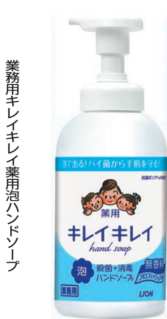
業務用キレイキレイ薬用泡ハンドソープ

ライオンハイジーンが提案している「業務用キレイキレイ薬用泡ハンドソープ」。泡切れがよく、すすぎが早いので、洗いがはるかに楽。食品に直接触れる厨房内の手洗いや、スプレータイプの殺菌成分が手にとどまる「殺菌ベール処方」を追加した。殺菌成分配合の泡が手全体をすばやく覆い、すすぎまで洗浄。ウイルス、菌を除去する。また、きめ細かな泡が汚れをすばやくキャッチし、しっかりと落とす。香り、容量も豊富にそろえた。旅館・ホテルの厨房内には「無香料タイプ」を薦めたい。無香料タイプは、洗剤の残り香を気にせず食材などを取り扱える。また、素早く次の作業に移行できる。