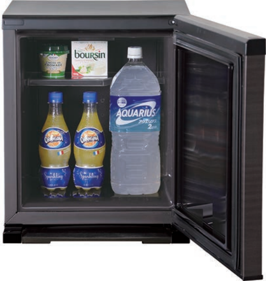
20%タイプ電子冷蔵庫

最新の「20%タイプ電子冷蔵庫」は、奥行きを575mmと薄くしたことが最大の特徴。静音性に優れたペルチェ方式を採用しているため、温度ムラが少なく、乾燥しにくい高品質の冷蔵保存も提供している。