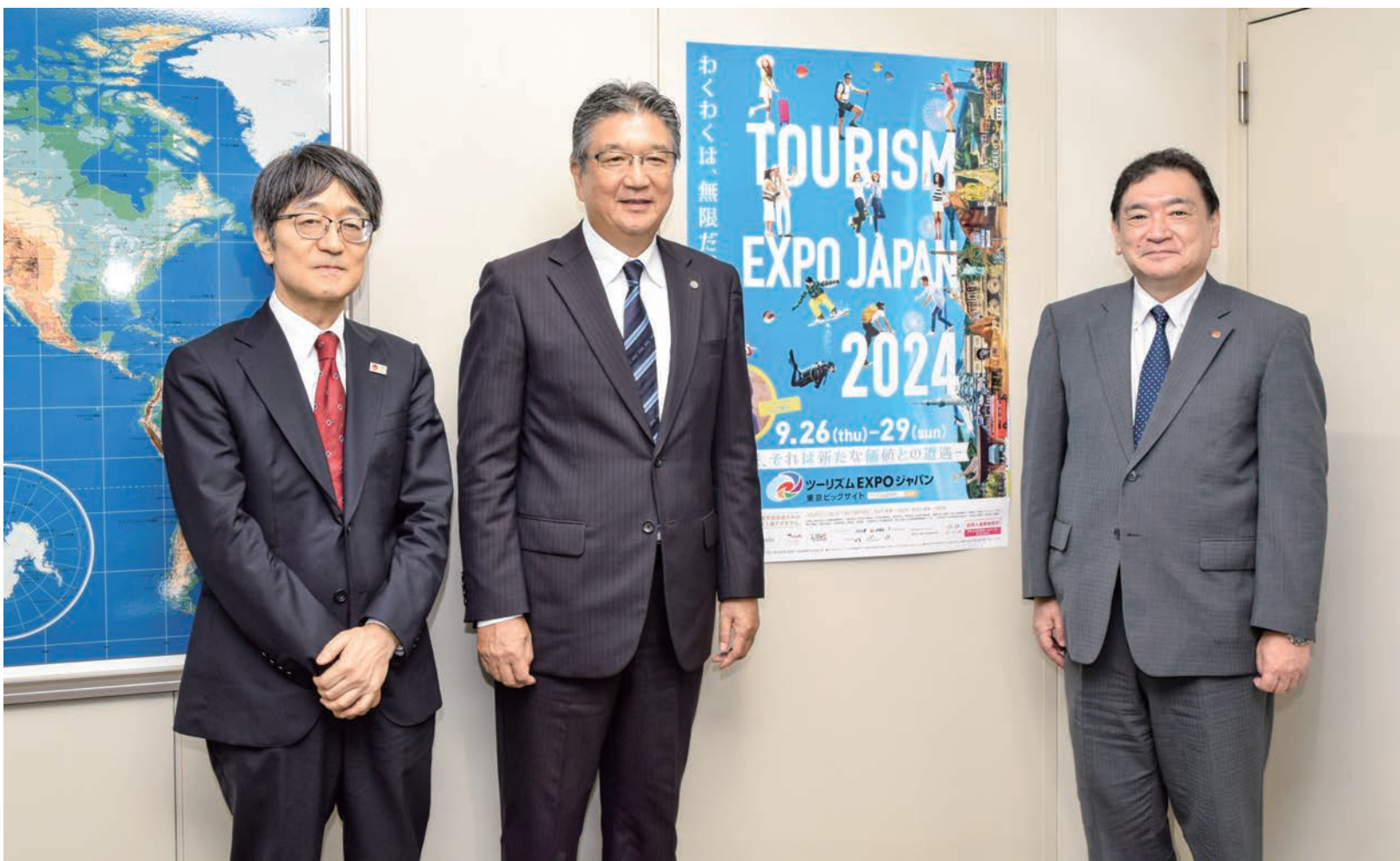
今年のツーリズムEXPOジャパンのポスターをバックに