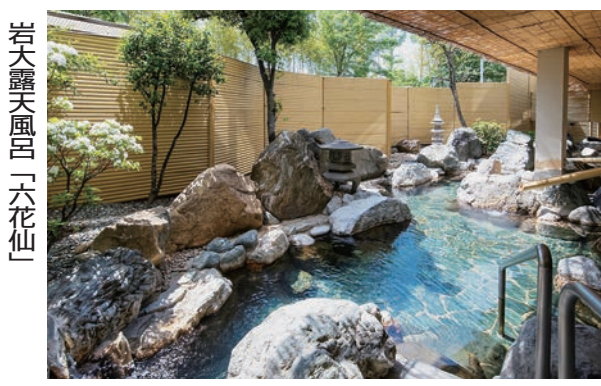
若大露天風呂「六花仙」