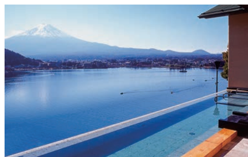
「大空の湯・星」のインフィニティ露天風呂