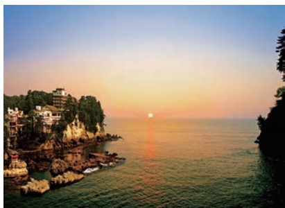
雄大な太平洋を一望できる絶景が自慢