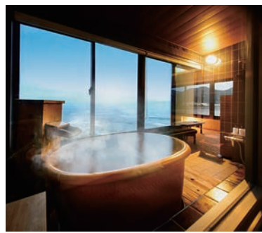
露天風呂付き客室

千葉県鴨川温泉郷天津小湊温泉の「宿中屋」は、創業が江戸時代の天保年間、房総半島先端切り露天風呂「浜千鳥」で美湯が味