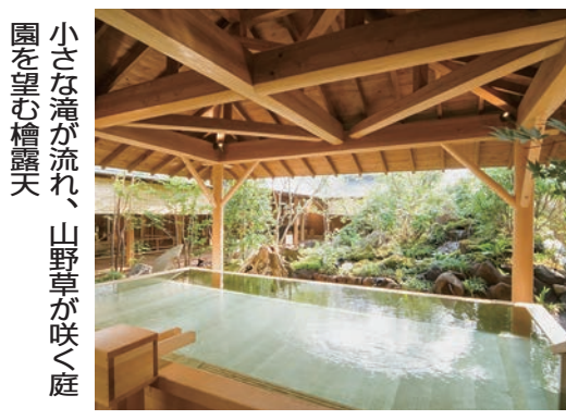
小さな滝が流れ、山野草が咲く庭園を望む檜風呂