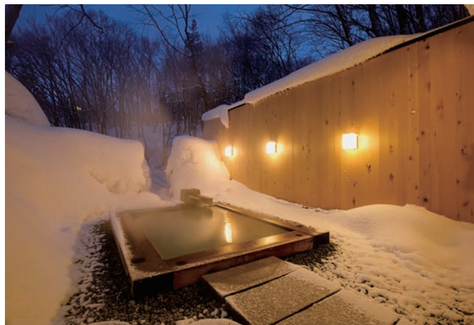
家族貸切風呂「大黒天」(冬)