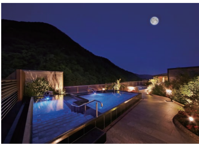
空中庭園露天風呂