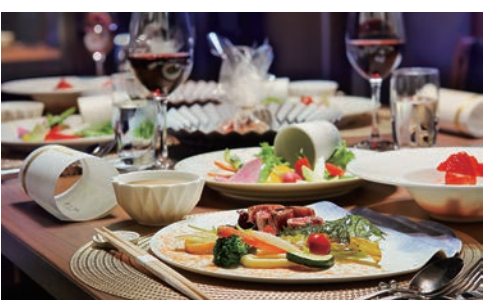
レストラン「Wisteria」の創作料理