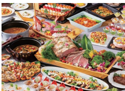
ビュッフェ湯雲で提供する料理(例)