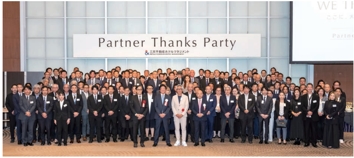
パートナー企業の代表者らと記念撮影(三井不動産ホテルマネジメントPartner Thanks Partyで)

三井不動産ホテルマネジメント(舊部代表取締役社長、東京都中央区)は、三井ガーデンホテル開業から40周年を迎えた。記念すべき節目を迎え、10月15日、パートナー企業への感謝を伝えるパーティーを東京ドームホテルで開いた。清掃、リネンサプライ、料飲などパートナー企業80社から1200人を招待。これからはパートナー企業との協働を重視し、「記憶に残るホテルになる。」の理念の実現を目指す姿勢を発信した。