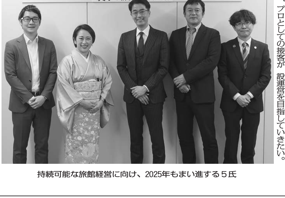
持続可能な旅館経営に向け、2025年もまい進する5氏