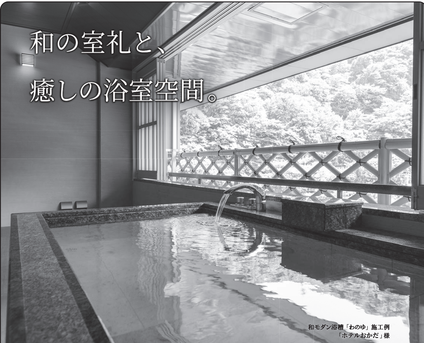
和モダン浴槽「わのゆ」施工例 「ホテルおかだ」様