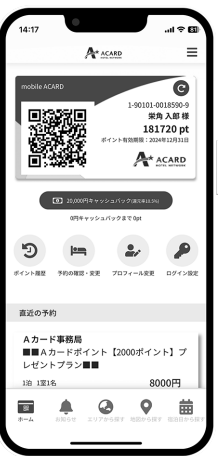
Aカード・アプリ画像

【会社概要】 【本社】東京都千代田区神田錦町2の5の16 名古屋ビル新館8階 【創業】1996年3月 【創立】2005年4月 【事業内容】独立系ホテルのキャッシュバックポイントカード運営 【資本金】1000万円 【従業員数】10人(2024年11月現在)