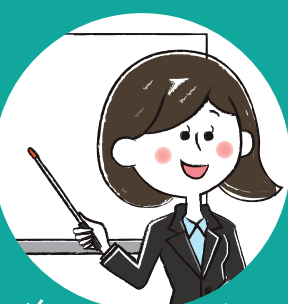
セミナー・講習会