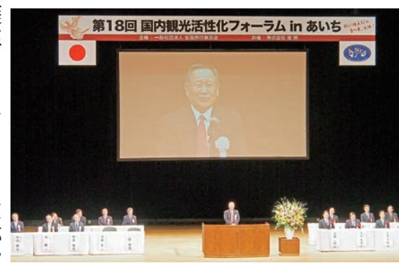
昨年のフォーラム(名古屋大会)の様子