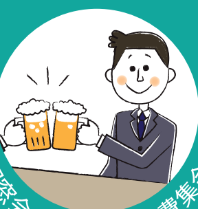
同窓会・社内行事・会費集金