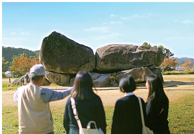
飛鳥の歴史に触れてみよう!

日本はじまりの地で、人との出会いを大切にしたい。大和飛鳥地域は、自然豊かな環境の中で、人々の心を育むことができる。飛鳥の歴史に触れてみよう!