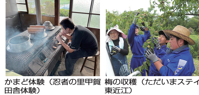
かまど体験(忍者の里甲賀 梅の収穫(ただいませステイ 田舎体験) 東近江)