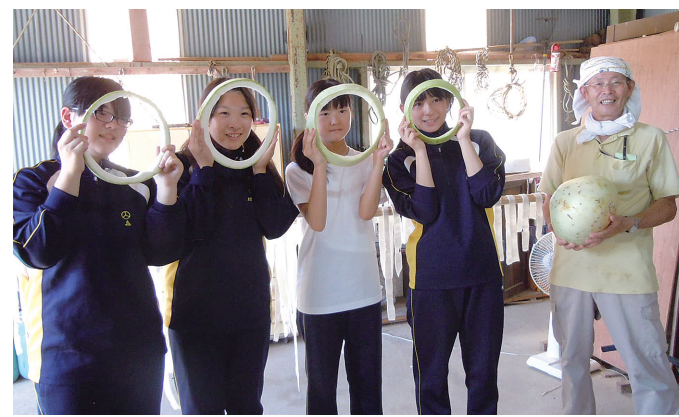
かんびょうの皮むき(三方よし! 近江日野田舎体験)