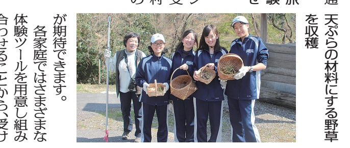
天ぷらの材料にする野菜を収穫

滋賀県東近江エリア 課題解決型修学旅行を提案。滋賀県東近江エリアは、自然豊かな環境の中で、人々の心を育むことができる。飛鳥の歴史に触れてみよう!