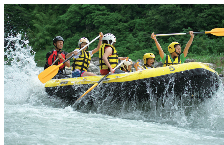
天竜川ラフティングでチームワークができる

なぜ今、南信州か? 賞、2017ワークルンジャー パンアワード受賞(農業) 深い学び、SDGs 理解 解学習、ESD(持続可能な開発) 学習のための 支障の養成に積極的 に取り組んでいます。 ○ラフティングなどの 200近い体験プログラムが用意されています。