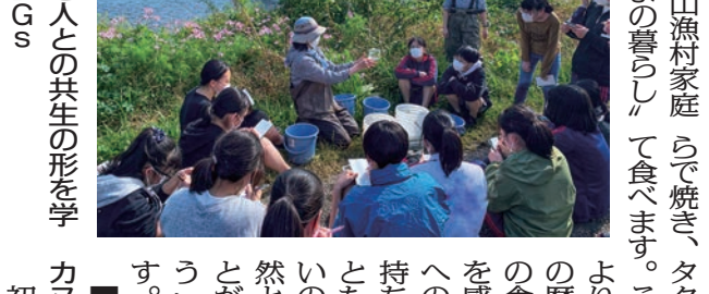
自然と人の共生の形を学ぶSDGs

四国西南部に位置する高知県の四万十・足摺(幡多)地域は、日本最後の清流といわれている「四万十川」を中心に、「足摺岬」など山、川、海と多様な自然環境に恵まれた地域です。