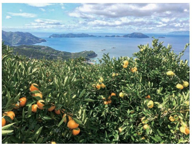
日本農業遺産に認定された柑橘農業システム