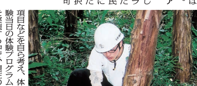
地域の特色を生かした体験プログラムの一つ、森林間伐

松浦党の里の感動体験から学ぶ探究学習。漁村・農村での民泊体験。地域の特色を生かした体験プログラム。