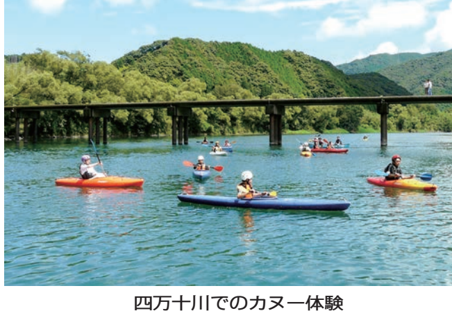
四万十川でのカヌー体験