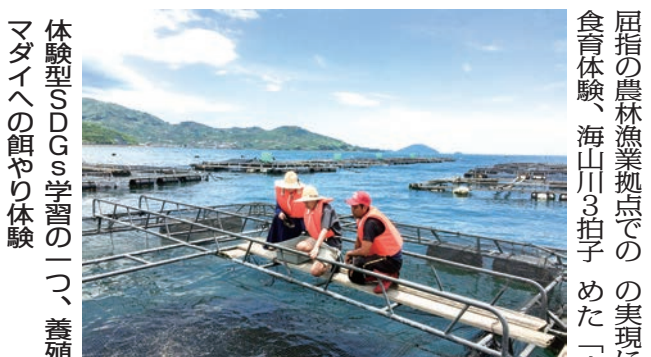
体験型SDGs学習の一つ、養殖

南予地域では、「主体的・対話的で深い学び」の実現に向けて、民泊を絡めた「南予版PBL」を実施しています。