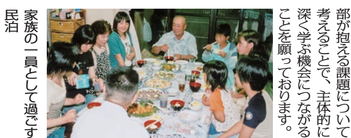
家族の一員として過ごす民泊体験

松浦党の里の感動体験から学ぶ探究学習。漁村・農村での民泊体験。地域の特色を生かした体験プログラム。