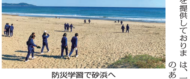
防災学習で砂浜へ