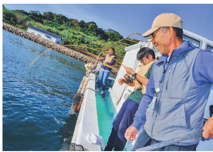
最大200人の受け入れ能力を有する船釣り体験