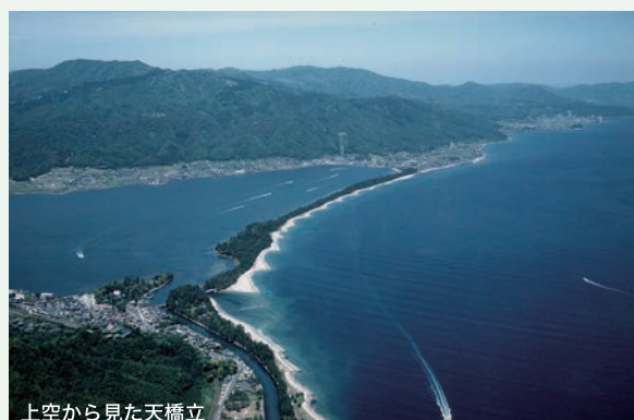
上空から見た天橋立