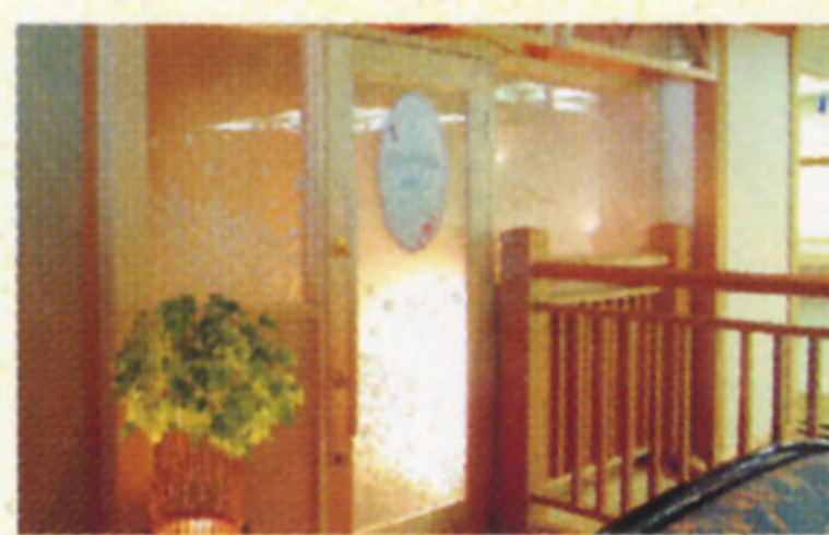
■1Fラウンジ「花ふる里」内