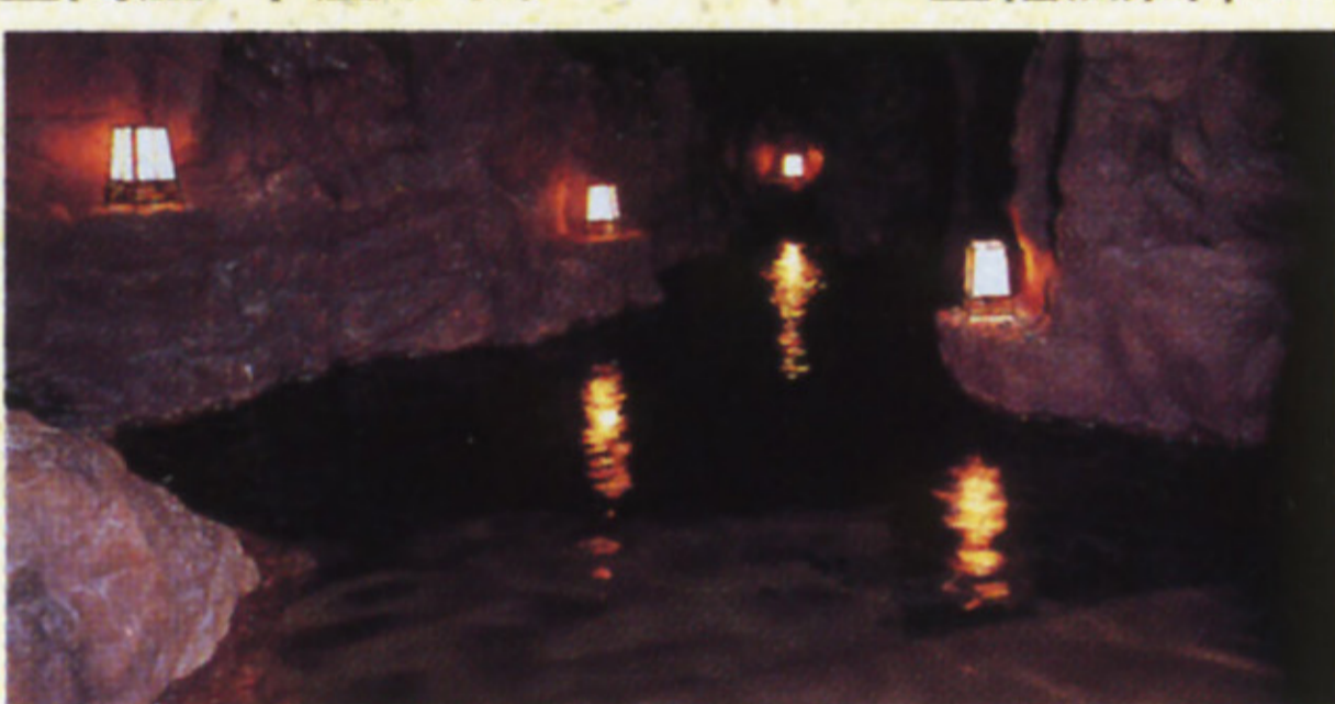
■洞窟風呂「かくれ湯」