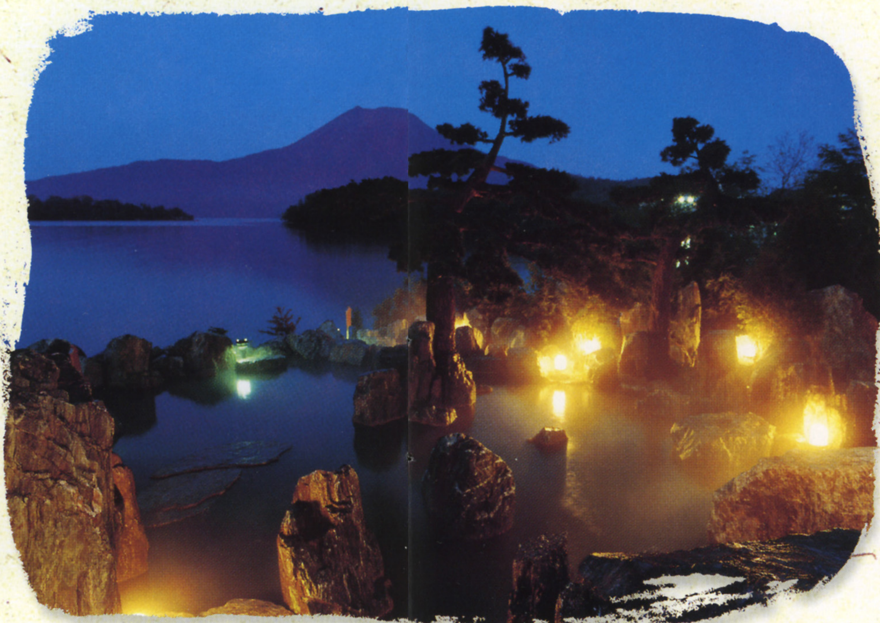
■庭園露天風呂「鹿泉の湯」

阿寒湖の秘湯のような露天風呂と趣向にあふれるお風呂の数々。湯に浸れば、少しずつ身体の中のしこりが解け出し、心とからだがゆつくりとほどこけてゆきます。