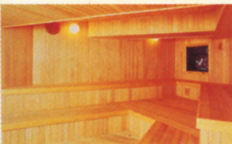
■高温・中温サウナ