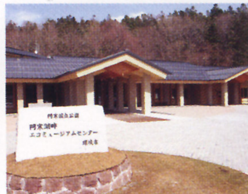
■阿寒湖畔エコミュージアムセンター