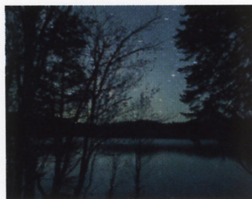
■スターウォッチング

四季それぞれの魅力に浸りながら、満喫できるアクティビティも豊富にご用意しております。阿寒でしか愉しめない体験がきっと待っています。