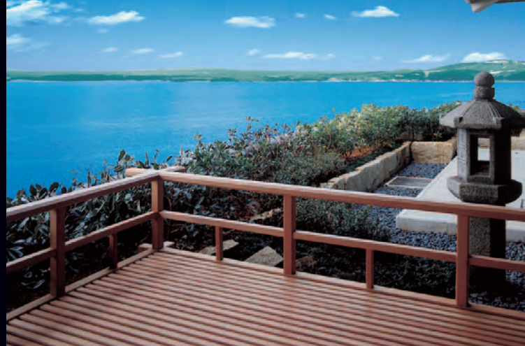
迎賓室“天游”より望む七尾西湾