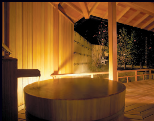
「能登渚亭」露天風呂付き客室