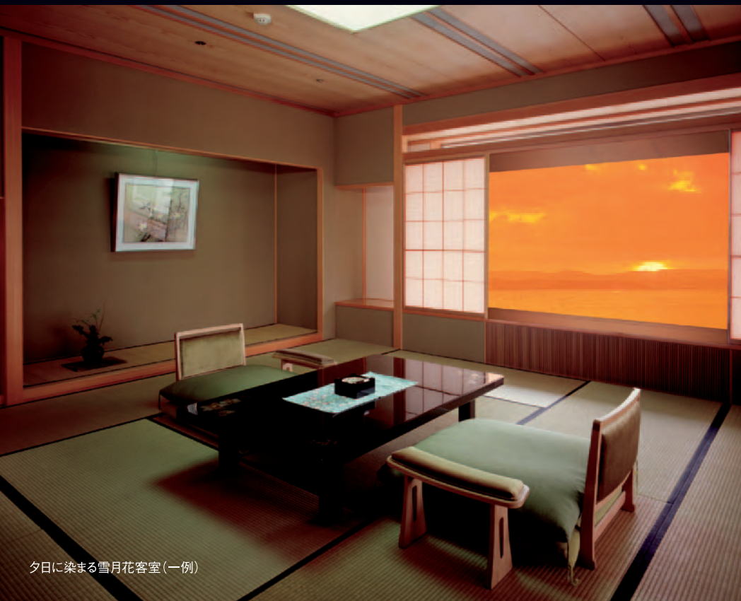
夕日に染まる雪月花客室(一例)