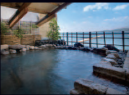
殿方大浴場「恵比寿の湯」空中露天風呂