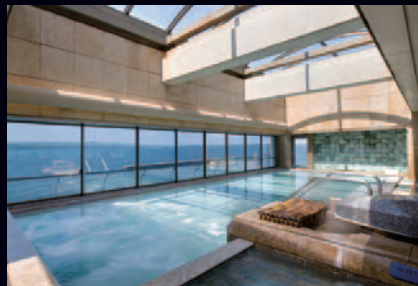
殿方大浴場「恵比寿の湯」

殿方用 「恵比寿の湯」: 空中露天風呂 / 野天風呂 / サウナ 婦人用 「辨天の湯」: 空中露天風呂 / 野天風呂 / サウナ 「花神の湯」: 野天風呂