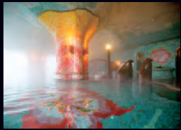
婦人大浴場「辨天の湯」野天風呂 婦人浴場「花神の湯」