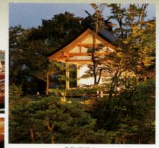
郷土芸能を披露する「月姫第」