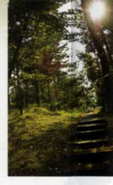
ヤマモミジやチャンチンなど 存在感のある木を配した 「水辺の森」