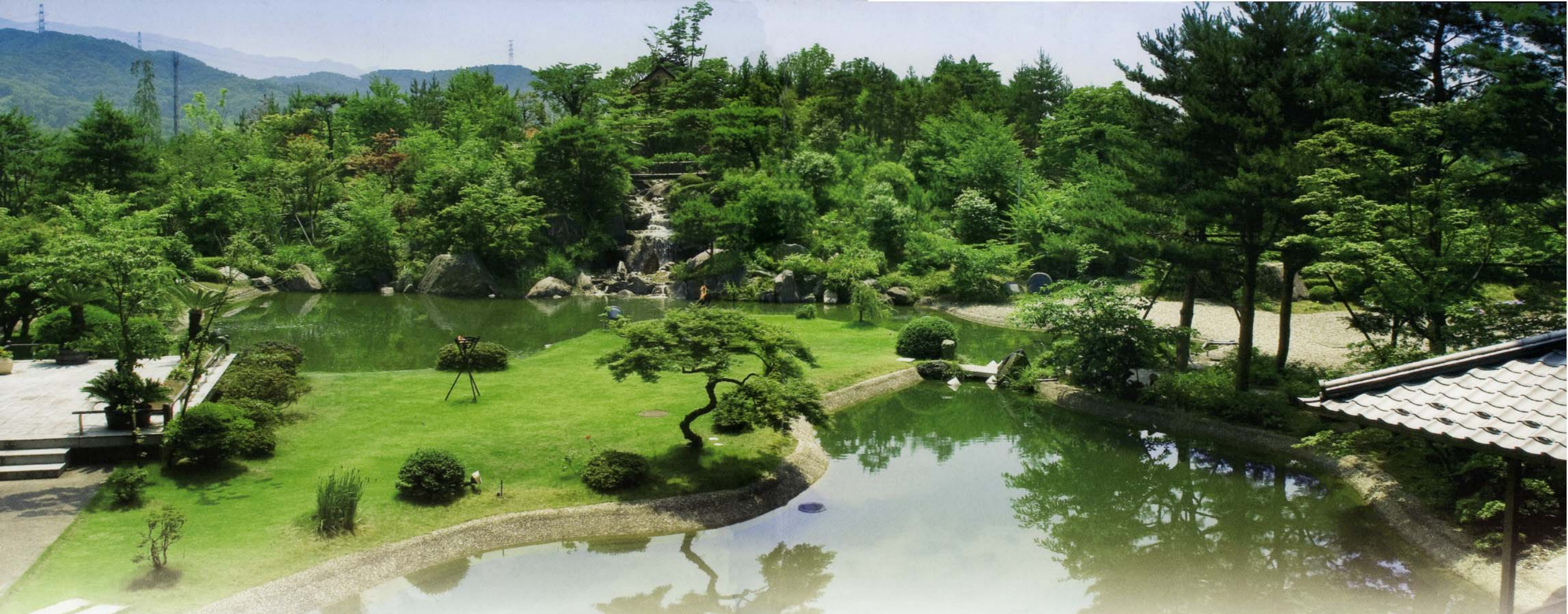
高台に月姫第を設けた 「鎮守の森」