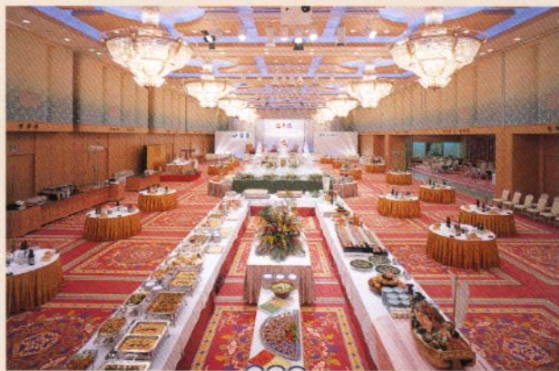
コンベンションホール 黎明

挙式から披露宴、 各種パーティー、 宴会やセミナーなど、 目的やスタイルに合わせて さまざまにご利用いただけます。