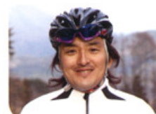
愛知県岡崎市出身 長野県松本市在住。 元シドニー五輪MTB日本代表。 MTBプロライダー引退後、 一般の方のライフスタイルに スポーツバイクの楽しさや、 生活を豊かにするために活動中。 BIKE RANCH代表。

信州の高原をオープンカーでドライブはいかがでしょう？ 春は高原に咲く花を愛でながら、夏は爽やかな風の中を、秋は一面の紅葉につつまれて…。 保険も完備しておりますので、万一の際も安心です。