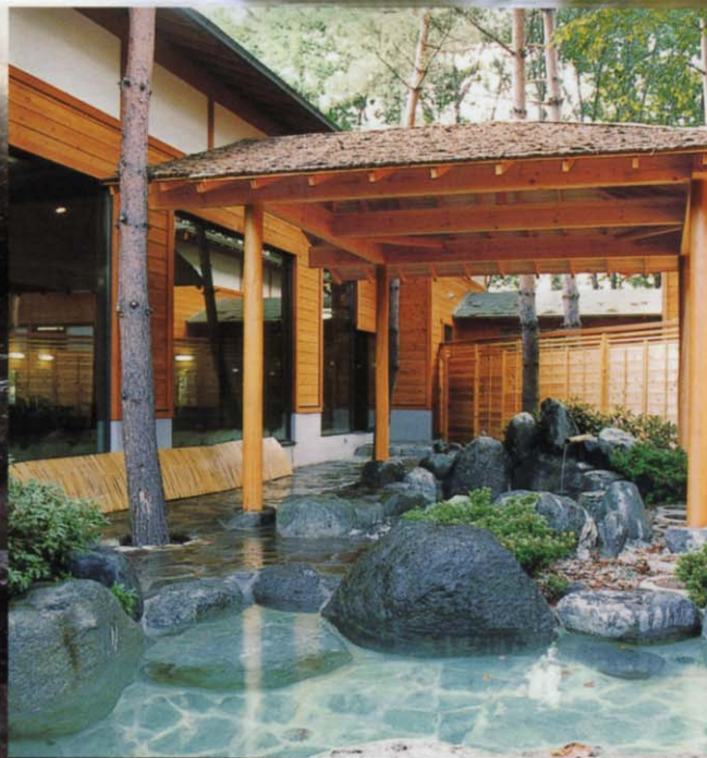
露天風呂「木立の湯」