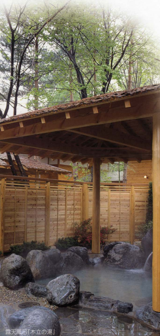
露天風呂「木立の湯」