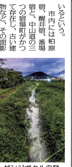
ゲンジボタルの発生地、市内長岡地区の天野川流域

その山頂は高山植物の宝庫となっており、「天空の花畑」の異名を持つ。頂上から一望できる琵琶湖の景色とともに登山客の目を惹きつけている。NHKで放送中の朝のテレビ小説「らんまん」の主人公のモデルとなった植物学者、牧野富太郎が伊吹山でさまざまな活動をしてきたことから、例年以上に訪れる人が増えている。