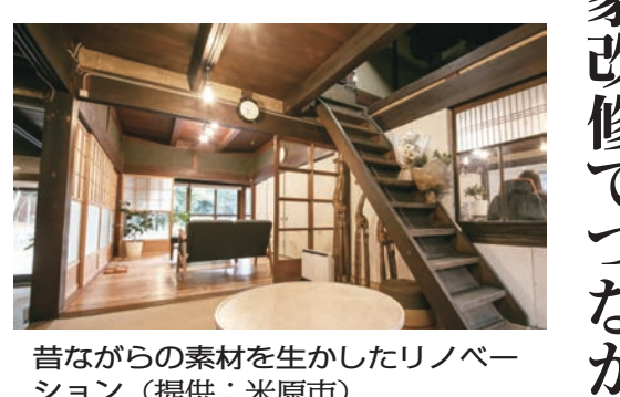
昔ながらの素材を生かしたリノベーション

同研究会は、市内の空き家問題解決のために平成26年度に組織化された。市内の空き家所有者の総