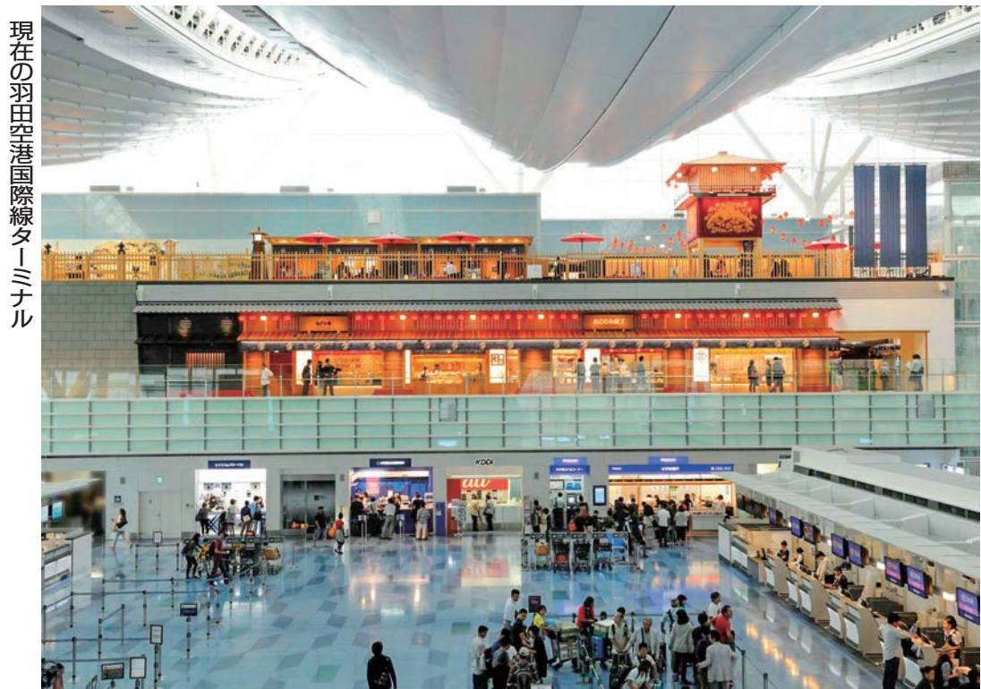
現在の羽田韓国国際線ターミナル