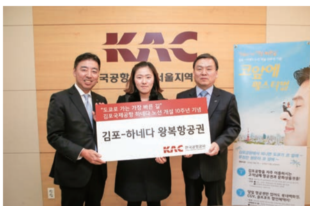
金浦—羽田就航10周年航空券贈呈式(2014年1月28日、金浦空港)