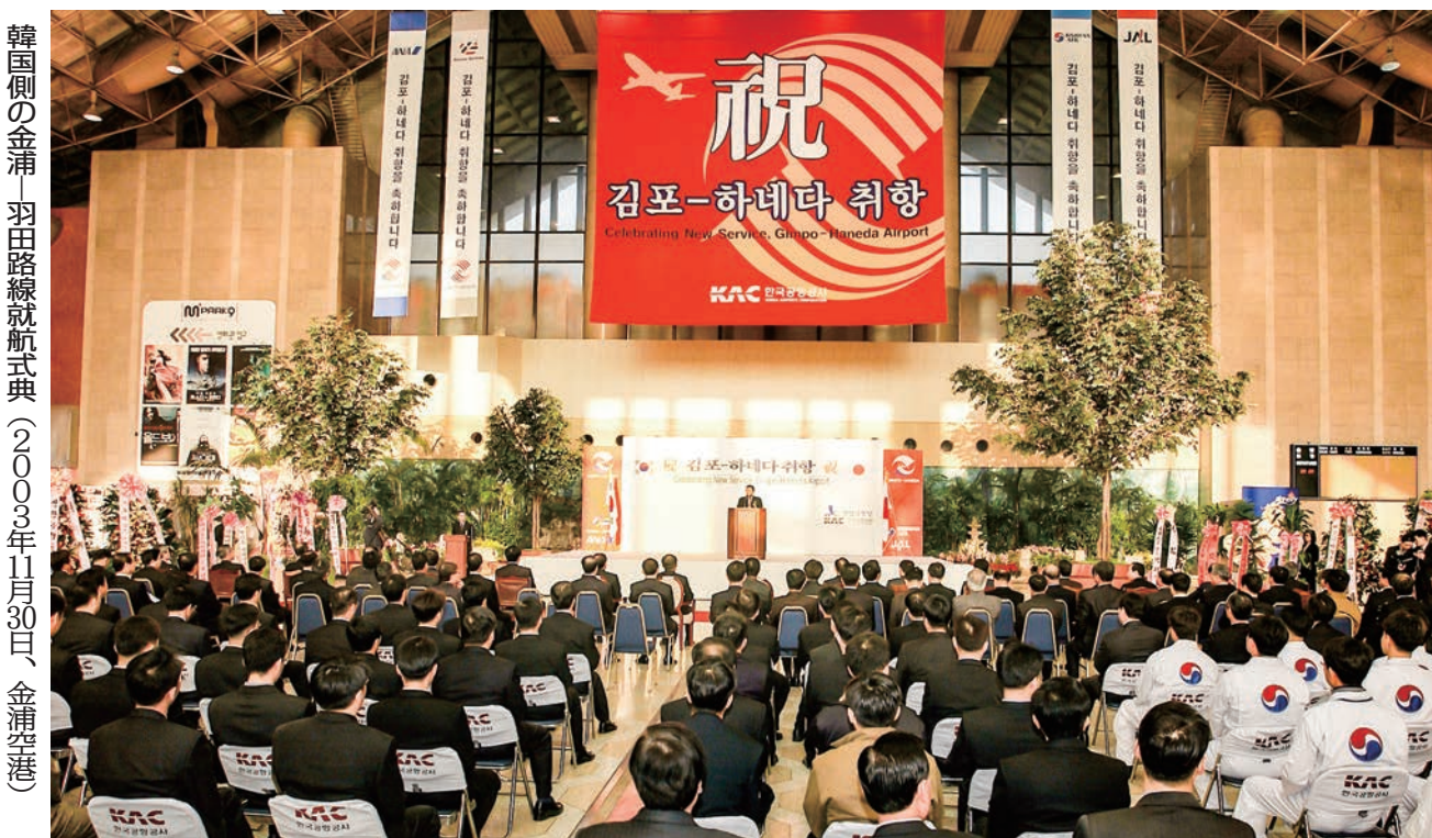
韓国側の金浦 羽田路線就航式典(2003年11月30日、金浦空港)