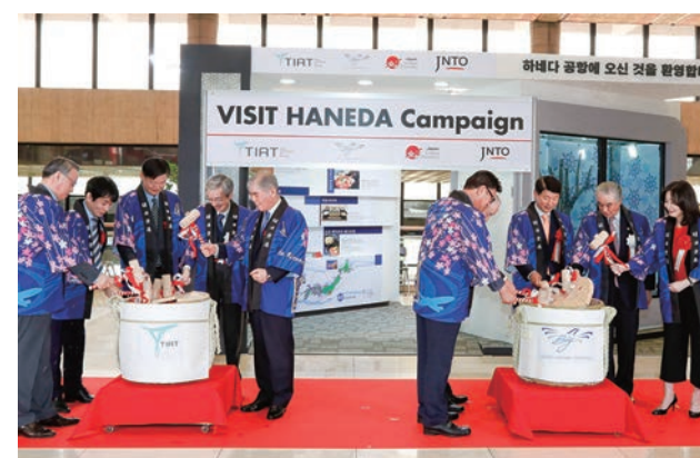
平昌五輪・羽田広報ブース開所式(2017年5月22日、金浦空港)