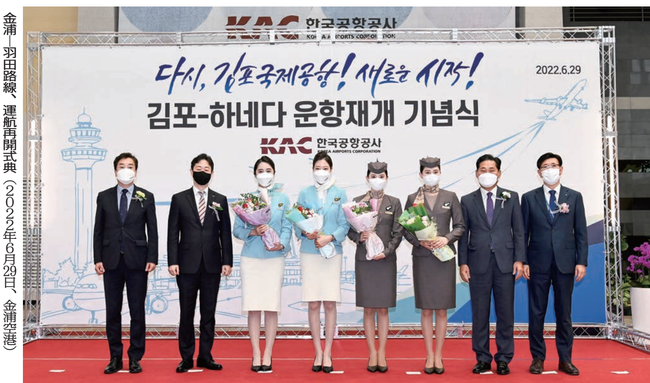
金浦 羽田路線、運航再開式典(2022年6月29日、金浦空港)