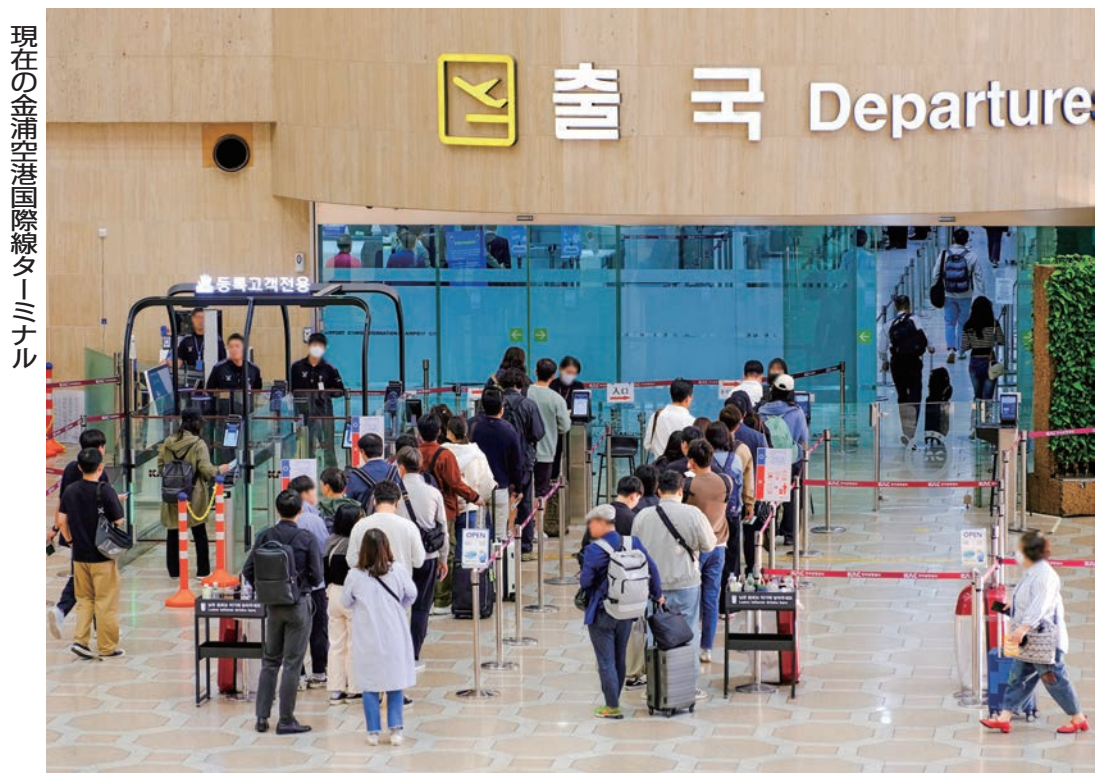
現在の金浦韓国国際線ターミナル