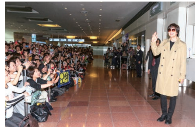
ペ・ヨンジュンが初来日。5000人を越すファンが詰めかける(2004年4月3日、羽田空港)