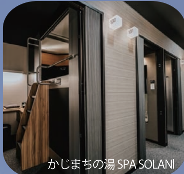
かじまの湯 SPA SOLANI