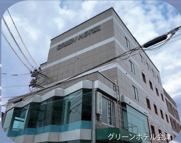
グリーンホテル会津