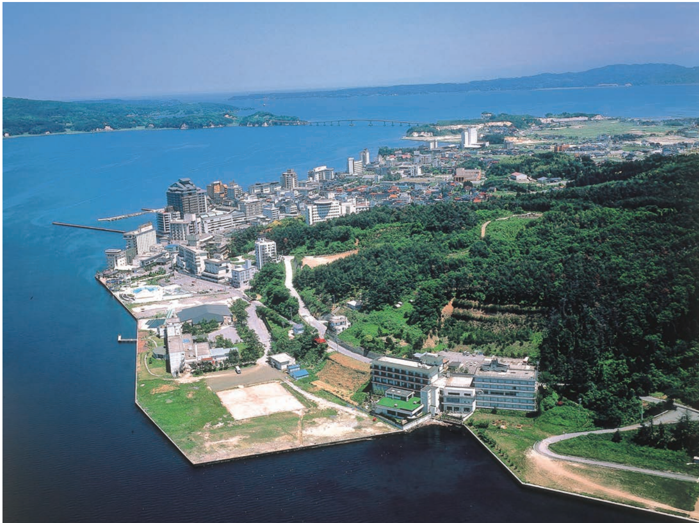
▲元日に令和6年能登半島地震が発生。石川県能登地方を中心に大きな被害を受けた(1月22日付)