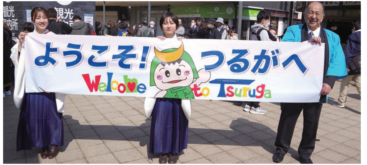
▶3月16日、北陸新幹線が延伸開業した。延伸区間の各駅では記念セレモニーや各種イベントが開かれた(3月25日付)