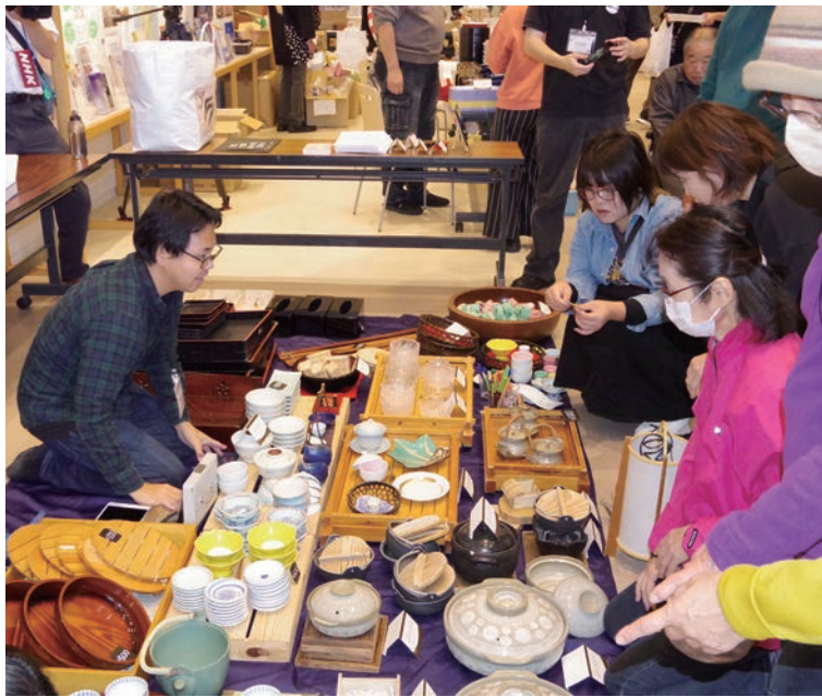
▲和倉温泉で11月3日、「和倉復興めぐる市」が開催され、各旅館で使われなくなった食器などを販売した(11月11日付)