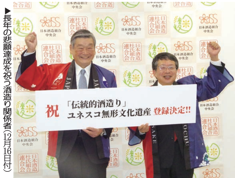
▶長年の悲願達成を祝う造り関係者(12月16日付)