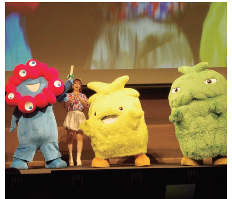
▲大阪・関西万博の開幕まで残り半年となった11月13日、大阪、東京で機運醸成イベントが行われ、来場日時予約などを呼び掛けた(10月21日付)