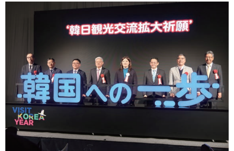
▲韓国文化体育観光部、韓国観光公社は3月22日、都内で「2024韓日観光交流の夕べ」を開いた(4月1日付)